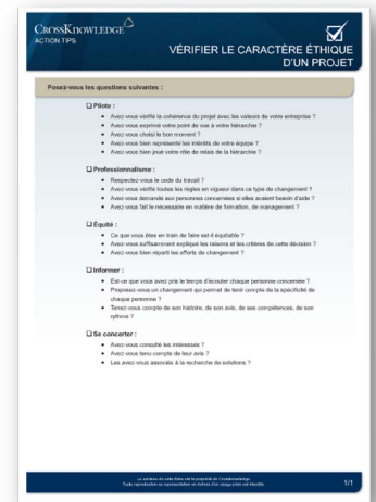
Exemple de checklist